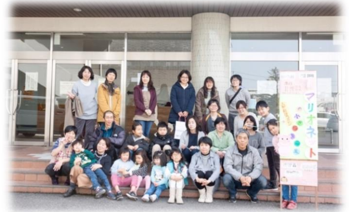
積み木のワークショップ・鑑賞例会・交流会へ たくさんの方に参加いただき、